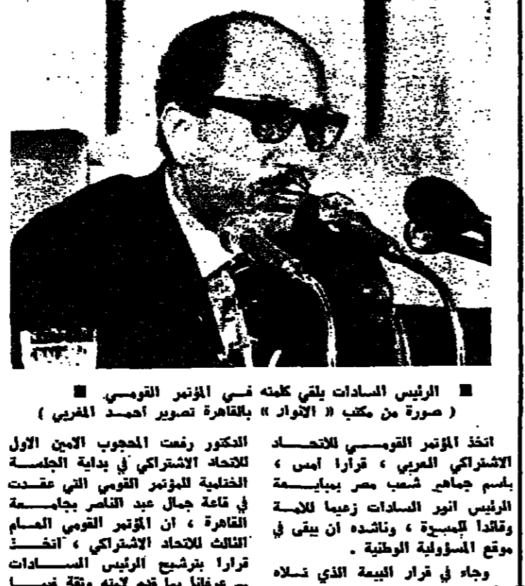
الرئيس السادات يلقي كلمته في المؤتمر القومي

الجيش الروحي للتحرير نفتت الخطبة الحكمة في لبنان ما كانت تسمية الجيش الروحي : فقد هبت رياح التغيير من داخل الكنيسة ولم يعد الطران غريفور حداد وحده ، بل صارت القوى التي تعني خارج العصر وحيدة . والبطش يقول ان الرصاص الذي لم يستطع قتل لبنان فتح عينه على الحقيقة . وتحتل الخطة التي ممجزة . وهكذا جاء الصوت الصارخ في البيرة والداعي الى التغيير من بيان مجلس البطرك الاسكندرية الكاثوليك الى توصيات المجلس الاداري للجمعية اللبنانية المروية والتي اعلم .